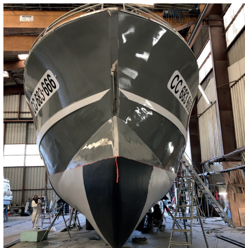
BATEAU EN PHOTO

(Travaux : Remise à neuf du bateau - peinture)