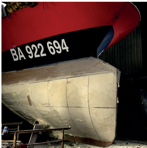
BATEAU EN PHOTO