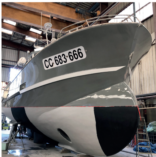
BATEAU EN PHOTO

Nos bulbes sont composés d'une structure en CTBX stratifié à la coque. Le volume est intégralement moussé et mis en forme avant stratification / infusion de l'ensemble. Enfin une étape d'enduits et de finition vient précéder la mise en peinture et traitements de carène.