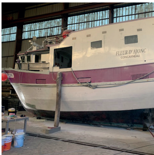
BATEAU EN PHOTO Le Fleur d'Ajonc

TRAVAUX RÉALISÉS Création de bouchains Peinture